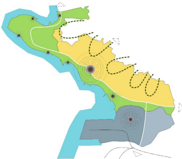
Slika 1: Zasnova prostorskega razvoja občine