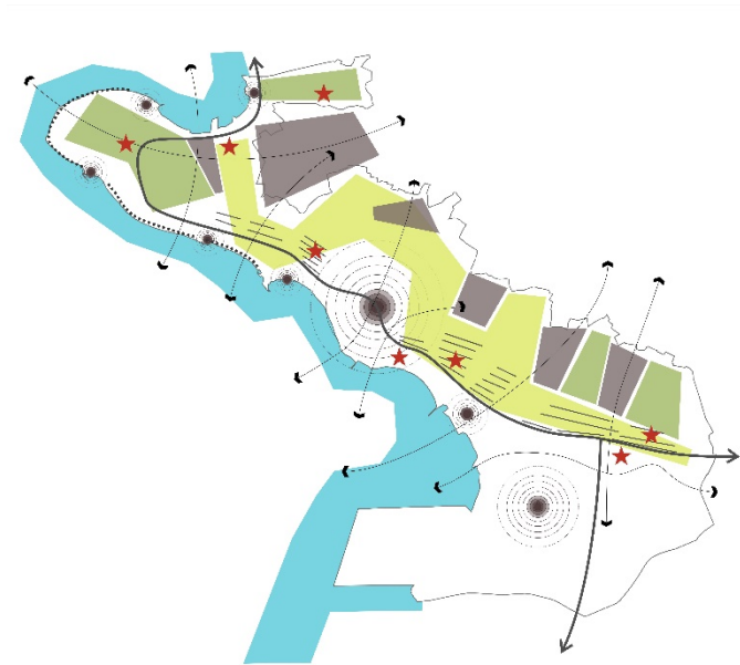
Slika 3: Koncept razvoja krajine občine Ankaran